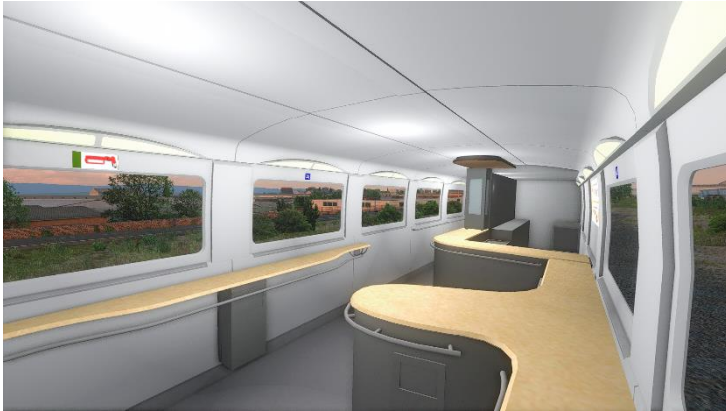
Detalle del interior del coche cafetería