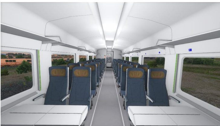
Detalle del interior de un coche de clase turista