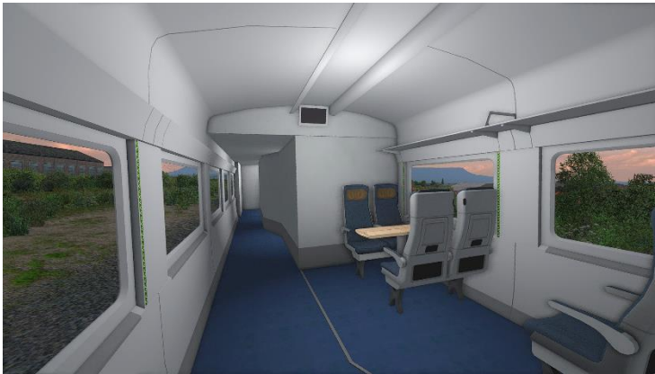
Detalle del interior del coche PMR

Para poder diferenciar a simple vista un coche de clase turista y preferente, simplemente debemos fijarnos en el color de los asientos: en un coche de clase preferente, el tapizado de los asientos será de color marrón, mientras que en un coche de clase turista el tapizado de los asientos será de color blanco/gris.