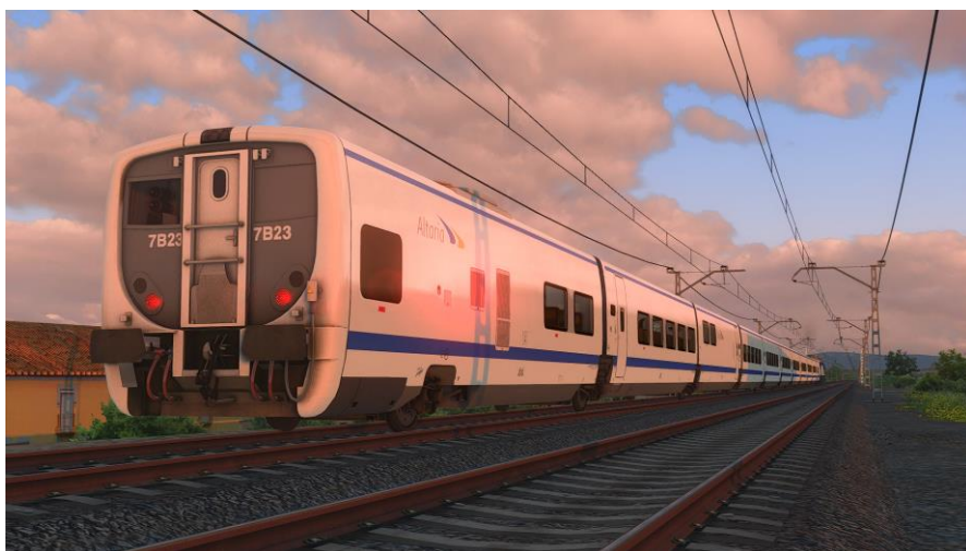
Altaria (REPINTADO FICTICIO)