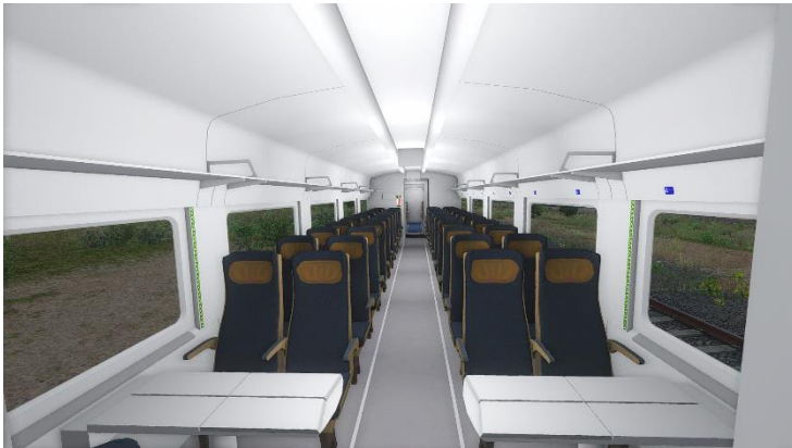
Detalle del interior de un coche de clase preferente